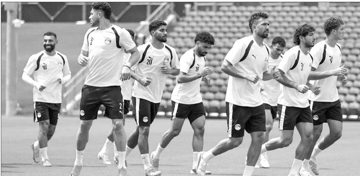
إبطال المنتخب المصري بتحصرون لخوض «ام المعارك» الموندبالية بمواجهة الأرجنتين

يتربص العالم العربي كما عشاق كرة القدم على أحر من الجمر، المواجهة المرتقبة بين منتخب مصر والأرجنتين، عند الساعة من مساء الثلاثاء، وذلك ضمن منافسات دور الـ١٦ بطولة كأس العالم لكرة القدم ٢٠٢٦.