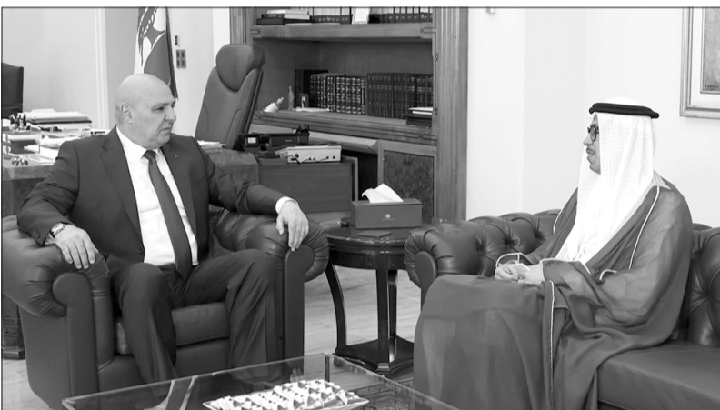
رئيس الجمهورية مجتمعاً مع السفير الإماراتي

لبنان، معتبراً أن الجيش والوقى الامنية اللبنانية هما حجر الأساس لاستقرار والامن في الجنوب، وعودة الاهالي إلى مناطقهم ومنازلهم. وأوضح أن تعليق الدعاوى بين إسرائيل ولبنان محصور خلال فترة المفاوضات، ولا يعني التخلي كلياً عن هذه الدعاوى. وختم بالتأكيد على أن لبنان لا يمكن للحرب الأهلية في لبنان، وأن عودتها إلى الساحة غير مطروح، على أمل إيقاف الفتنة، وأشار بالدور الذي لعبه رئيس مجلس النواب نبيه بري الذي يعمل من أجل التهدئة والتحذير من مخاطر الفتنة، إضافة إلى تأييده وقف إطلاق النار وانسحاب الإسرائيليين من الجنوب، مؤكداً بالجهود التي بذلها بري لإعمار الجنوب وازدهاره خلال الفترة السابقة. بدوره، أعرب أعضاء الوفد عن تقديرهم للمساعي التي يبذلها الرئيس عون في نهض لبنان ويعمل على ترسيخ أمن واستقرار وسلام دائمين، واندكا