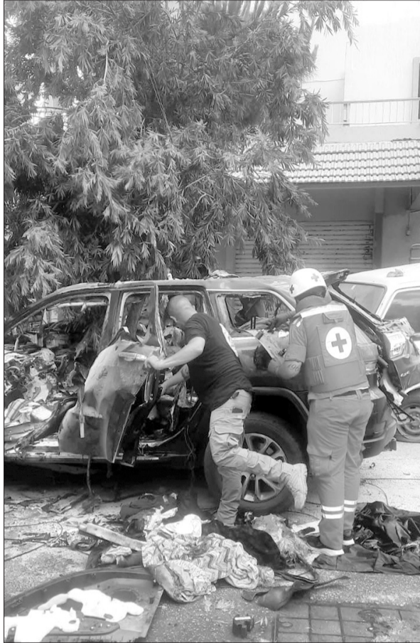
السيارة التي استهدفها العدو وسقطت فيه الرمية اسبيرنزا غندور و٣ شهداء آخرين