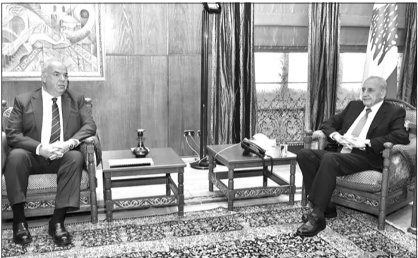
الرئيس بري مستقبلاً الوزير الحاج (حسن إبراهيم)

بري على «وجوب أن تتحرك الدولة اللبنانية والمجتمعين العربي والدولي لوقف عملية التدمير المنهج ونسف القرى الجارية على قدم وساق في مدينة بنت جبيل وقرى قضاها وفي أفضية مرجعيون والنبطية وصور، والتي إن دلت على شيء إنما تدل على النيات الخفية للعدو الإسرائيلي يجعل مناطق واسعة من الجنوب اللبناني مناطق غير قابلة للحياة وهو أمر لم يعد جائزاً أن يواجه بصمت كما هو حاصل اليوم».