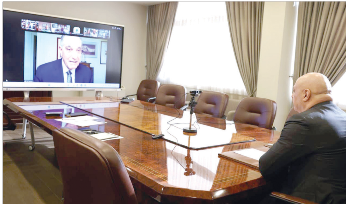
الرئيس عون يحاور مجموعة العمل الأميركية (Task Force for Lebanon) عبر تقنية الفيديو