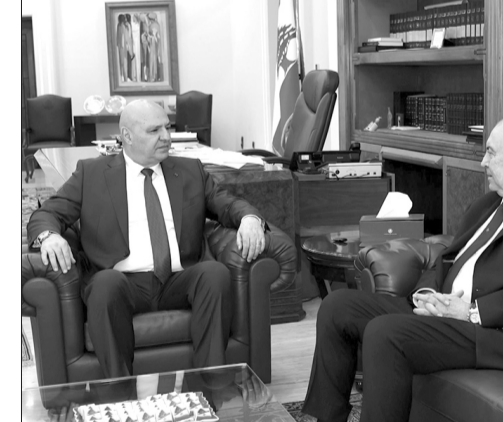
الرئيس عون مستقبلاً النائب مخزومي

ويضرب بمصالح لبنان العليا». وقال: «ليس أمام لبنان اليوم بديل واقعي عن هذا المسار، فأما أن تستعيد الدولة وسيادتها وثقة العالم العربي والمجتمع الدولي، أو أن تبقى أسرى النزاع والعزلة والانهيار، كما اقترحت على رئيس الجمهورية أن تعتمد الحكومة، بالتوازي مع تنفيذ الترتيبات الأمنية، استراتيجية وطنية للتعايف وإعادة الإعمار والتنمية في المناطق التي تستعد الدولة ومسؤوليها فيها، بالتزامن مع تنفيذ مراحل بسط سلطة الدولة وانتشار الجيش اللبناني بعد تسلم الدولة سلاح حزب الله وفق الآليات التنفيذية المعتمدة».