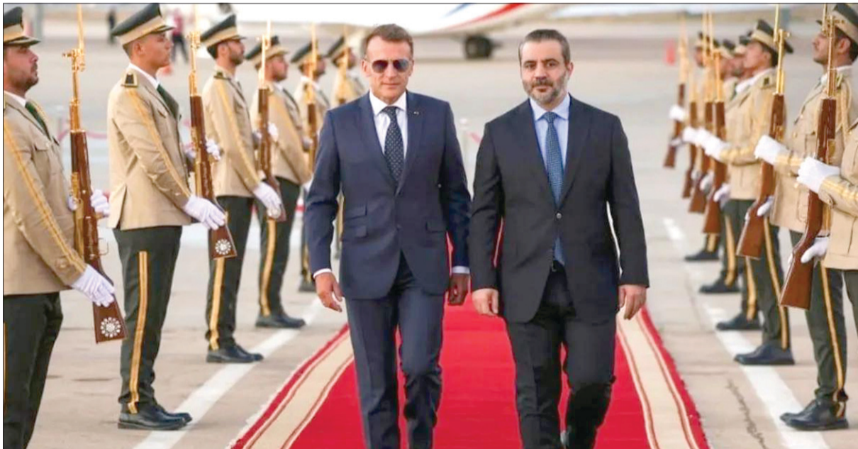
وزير الخارجية السوري أسعد الشيباني مستقبلاً الرئيس الفرنسي إيمانويل ماكرون في مطار دمشق الدولي