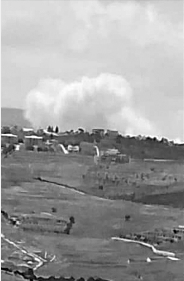
التجريح في كوثين

واضحة لتعريف ما تصفه «حرب الله»، جنباً لاي خلافات قد تؤثر على تنفيذ التفاهات. وبحسب تقرير للصحافيين إيتاي بلومنتال وغيلي كوهين في هيئة البث الإسرائيلية «كان»، فتح ضباط من الجيش الإسرائيلي والجيش اللبناني خلال الأيام الأخيرة قناة تواصل بواسطة أميركية، تهدف إلى وضع معايير واضحة تحدد مفهوم «المنطقة الخالية من حرب الله»، قبل انطلاق المرحلة التجريبية للانسحاب من قريتين في جنوب لبنان. وأشار التقرير إلى أنه في السابق كانت إسرائيل تنقل، عبر آلية التنسيق، معلومات استخباراتية إلى الجيش اللبناني بشأن نشاطات حرب الله، إلا أن هذه المعلومات، وفق الرواية الإسرائيلية، كانت تتسرب إلى الحزب.