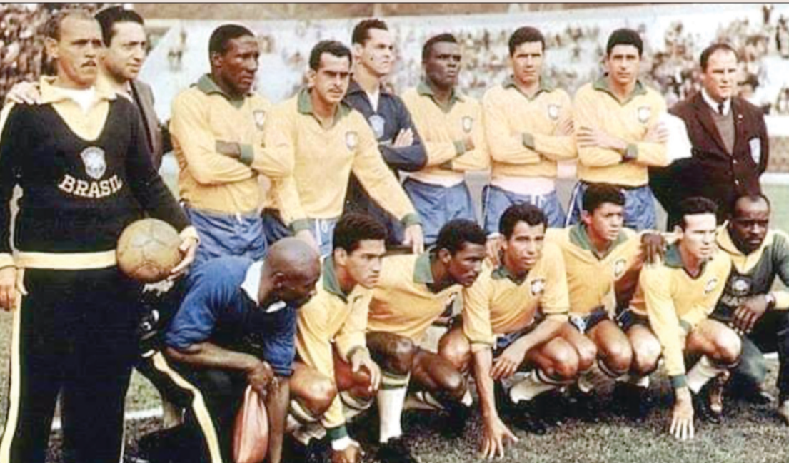
منتخب البرازيل الفائز بكأس العالم عام ١٩٦٢

قبل اشهر قليلة من اندلاع أزمة الصواريخ الكوبية التي كادت تشعل حربا عالمية ثالثة، اتجهت انظار العالم إلى تشيلي، التي استضافت بين ٣٠ مايو و١٧ يونيو ١٩٦٢ النسخة السابعة من كأس العالم لكرة القدم. فقد شارك في البطولة ١٦ منتخباً مثلوا ثلاث قارات، بينهم منتخب بلغاريا وكولومبيا اللذان ندلا سجل المشاركات للمرة الأولى.