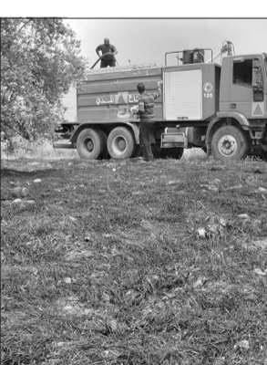
خلال إخماد الحريق في الشمال

انلح حريق كبير في بلدة بيت الحوش عكار طال مساحات واسعة من بساتين الزيتون والحشائش والنباتات اليابسة في خراج البلدة. وعلى الفور هرعّت فرق الدفاع المدني مركز برقايل إلى مكان الحريق مدومة بجهود الأهالي الذين سارعوا للمساعدة في محاصرة النيران ومنع امتدادها إلى بساتين مجاورة، وقد واجهت الفرق صعوبة كبيرة في السيطرة على الحريق بسبب سرعة الرياح وطبيعة المنطقة الجبلية واتساع مساحة الأرض المحروقة وكثافة الأشجار اليابسة.